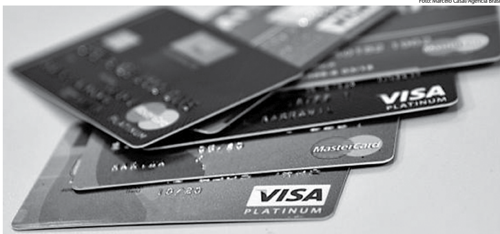
Taxa de crédito parcelado também subiu e ficou em 161,9% ao ano, resultando numa alta de 8,1 ponto percentual em relação a dezembro, diz o BC

Esses dados são do crédito livre em que os bancos têm autonomia para aplicar o dinheiro captado no mercado e definir as taxas de juros. No