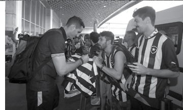
Na chegada dos jogadores no aeroporto do Rio, a torcida fez grande festa

“Tem um sabor diferente por causa do Olimpia. Eu, pessoalmente, consegui deixar o Olimpia de fora. Então tem um sabor especial. Minha família estava muito feliz. Encontrei meu pai, minha mãe. Sabiam que eu tinha uma pressão por ser o Olimpia - concluiu o novo xodó da torcida do Botafogo em 2017.”